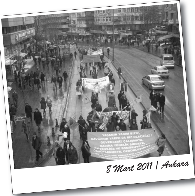
8 Mart 2011 | Ankara

Ankara'da gerçekleştirilen 8 Mart eylemi coşkulu bir atmosferde Sakarya'da yapıldı. Çevreden ilgiyle izlenen eylem boyunca 8 Mart'ın ruhuna yakışır devrimci bir hava hakimdi.