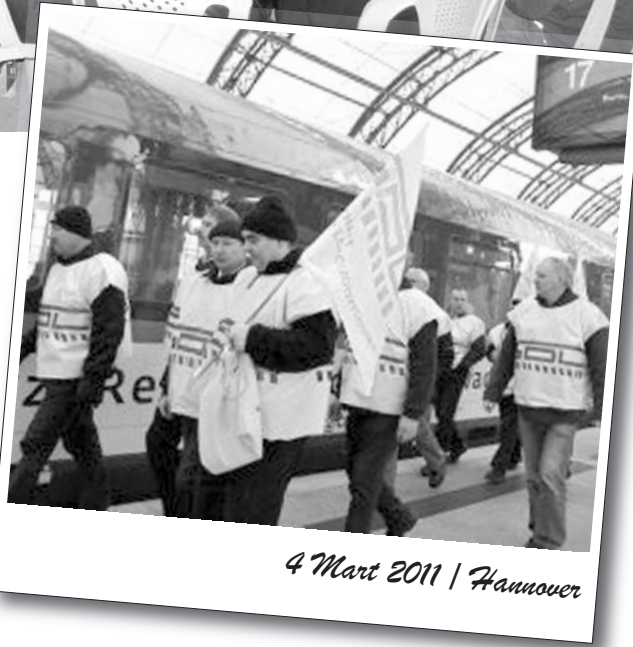
4 Mart 2011 | Hannover

Şirketin iflas ettiği iddia edilerek bir anda işsiz bırakılan 500'e yakın çalışan bağlı oldukları Hava-Sen ile beraber altı aya yakın bir süredir çeşitli eylemler ve basın açıklamaları yaptı. Ancak burjuva devletin sözlü aldatmacalarının dışında bir yanıt alamadılar.