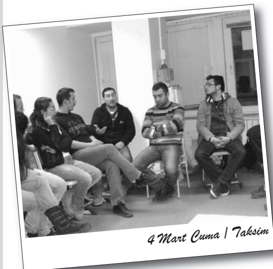
4 Mart Cuma / Taksim

Devrimci 8 Mart mitinine katılan Genç-Sen üyeleri 4 Mart Cuma günü Makine Mühendisleri Odası İstanbul Şubesi’nde bir söyleşi gerçekleştirdiler.